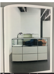
Conférence de choses

+ Le 31 janvier à 18h au musée des Beaux-Arts, le 1 er février à 18h au théâtre d'Orléans