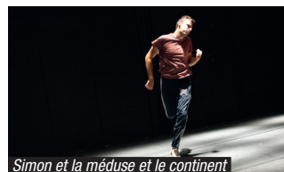
Simon et la méduse et le continent