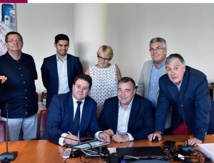
Signature de l'accord pour la cession et la réhabilitation du site Quelle, à Saran.